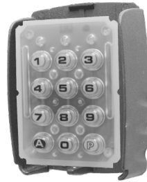
Boîtier Cajetines Boxes