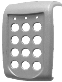
Face avant métallique Frente metálico Metallic front face